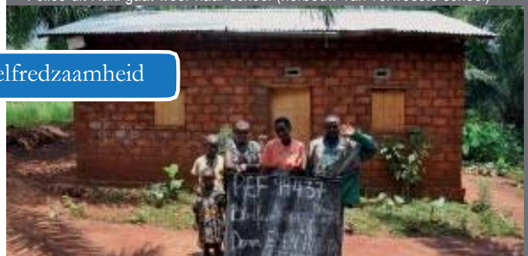
Jacques uit Burundi: een eigen huis met een stuk landbouwgrond (na tien jaar vluchtelingenkamp)