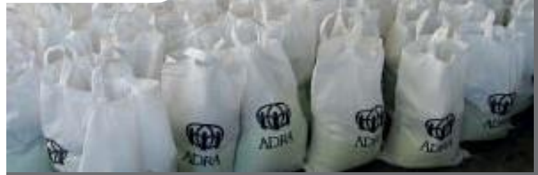
3.500 voedsel- en hygiënepakketten uitgedeeld in rampgebied